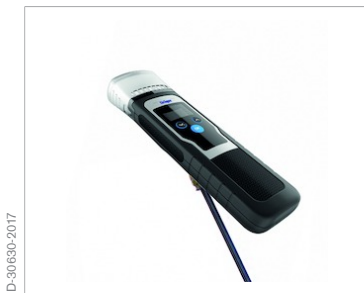
Rosca de 1/4" para acoplar un palo de selfie