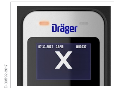
Símbolo "Alcohol detectado"