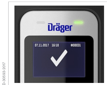
Símbolo "Alcohol no detectado"