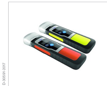
Juego opcional de láminas reflectoras (amarillas o naranjas)