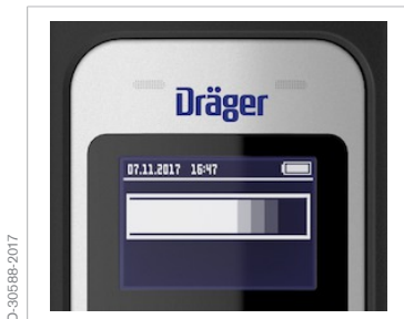
Símbolo "Prueba en curso"