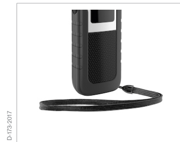
Empuñaduras y correas para la muñeca para una sujeción segura