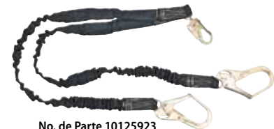
No. de Parte 10125923