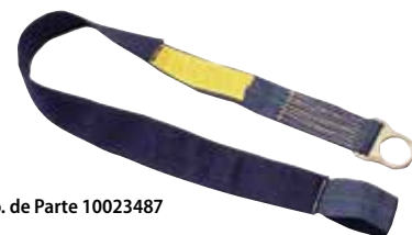
No. de Parte 10023487

Need it NOW! es nuestro programa de entrega de protección contra caídas diseñado para que obtenga los productos que necesita, cuando los necesita: ¡AHORA!